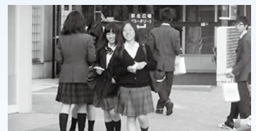
〈瑞浪駅での啓発活動〉