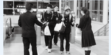
〈多治見駅での啓発活動〉

東濃西部少年センター 〒507-0034 多治見市豊岡町 1-55 ヤマカまなびパーク4F ☎ <0572>23-3455 Fax <0572>26-8813