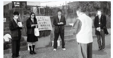
〈土岐市駅での啓発活動〉