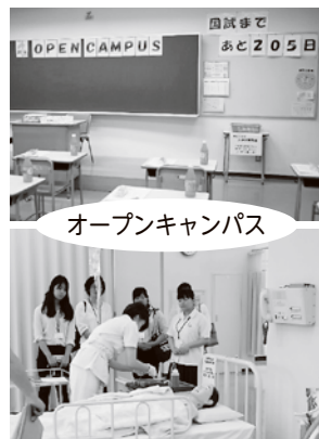
オープンキャンパス

5 Q 印象に残った授業や行事を教えてください A フィジカルアセスメント: 技術でここまで人体内部の 事が分かるのか!と驚いた 母性看護学: 模型など使い分かりやすく楽しい こんな に難しいとは 息をつく間がない 公衆衛生学: 校外で地域の方にインタビューして様々 な意見を聞き、広い範囲のことを考えた 運動会: ついはしゃいでしまう クラスの仲が深 まる 来年も楽しみ 予 餞 会: 発表を見るのが楽しい いつも厳しい先 生の気合いの入ったダンスが印象的