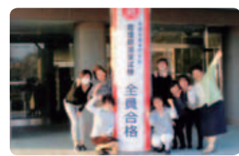
国家試験全員合格

☆第108回(平成30年度) 看護師国家試験合格率 100% (全国平均 89.3%)