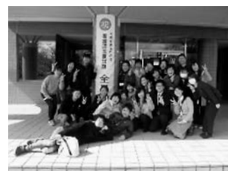
国家試験全員合格