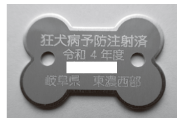
令和4年度注射済票 見本

(注1) 注射済票の交付が出来ない動物病院もありますので、交付出来る動物病院については、広域組合のホームページにてご確認ください。交付出来ない動物病院で接種された方は、接種証明書(注射済証)を発行してもらい、市の担当窓口で交付の手続きを行ってください。